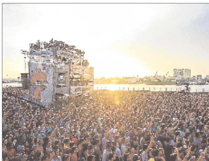
Imagen del público, con más de 9.000 personas.

De este modo, ante los nuevos acontecimientos, Arkano se convierte en el primer rapero español en obtener dos títulos nacionales de batalla de gallos de Red Bull (puesto que ya obtuvo otro ante-