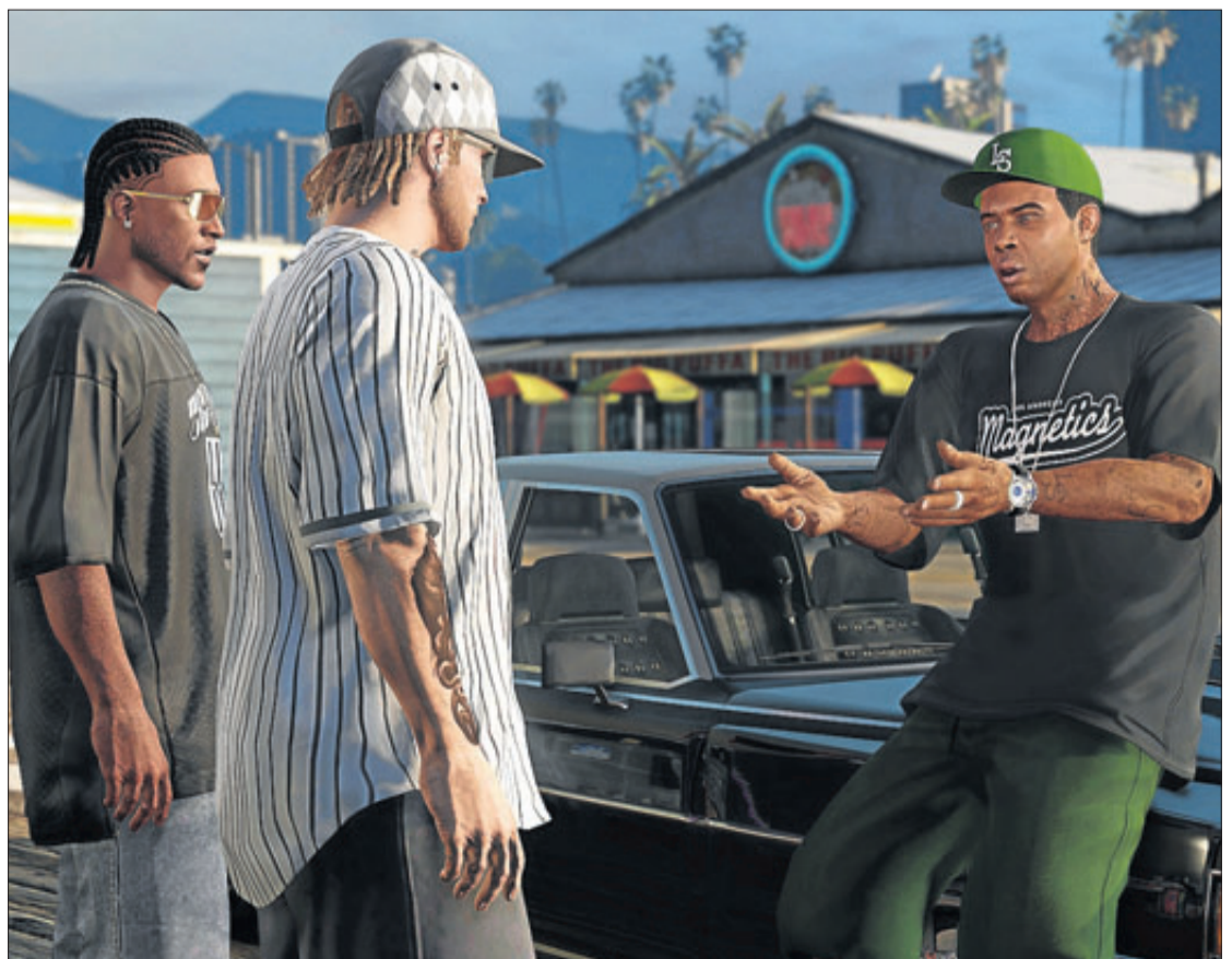
Las historias de Flowstreet y Stratus se inspiran en el videojuego GTA (Grand Theft Auto) . INFORMACIÓN