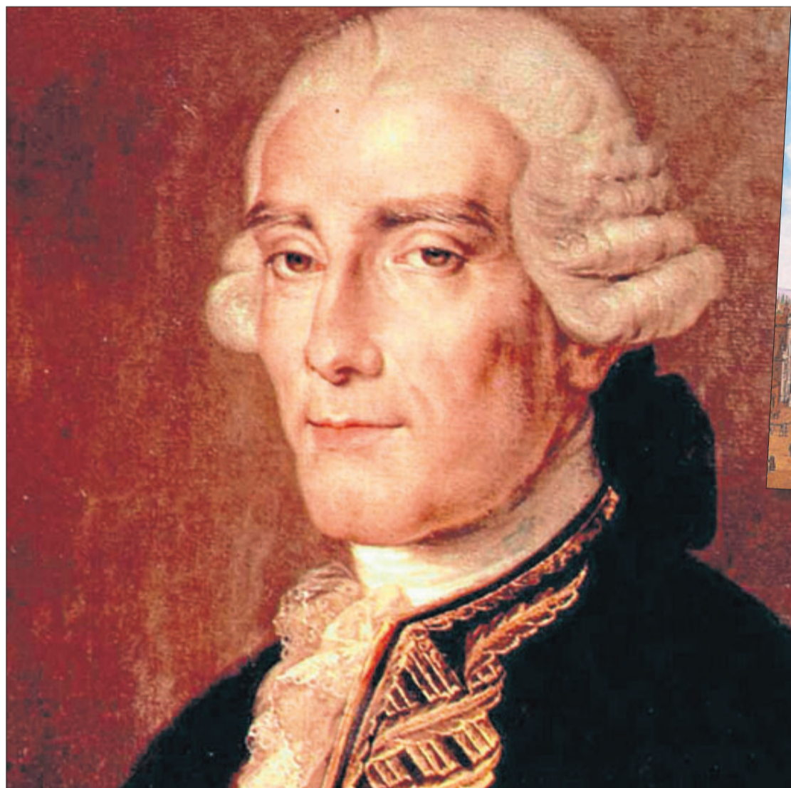
El espía, científico y matemático alicantino Jorge Juan.

«En la trama aparece la figura de una mujer ilustrada, que encaja con una figura ilustre como Jorge Juan, por lo que es una mujer con ciertos fundamentos académicos. A Jorge Juan le situó con su