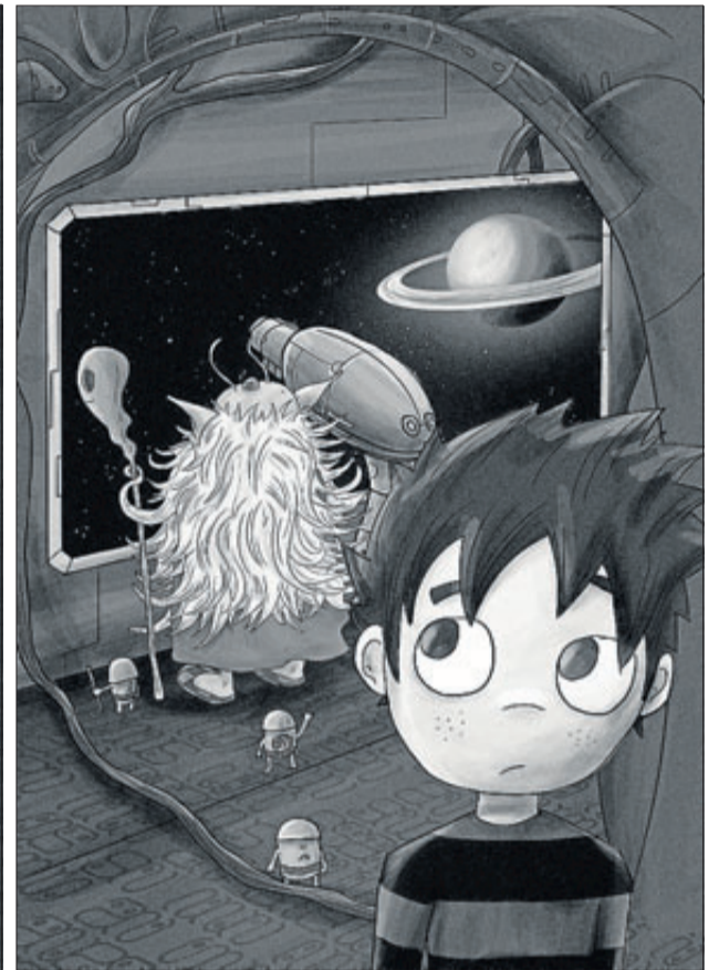
Fran Ferriz ha trabajado casi 100 ilustraciones en un proceso de más de dos años en este libro. INFORMACIÓN